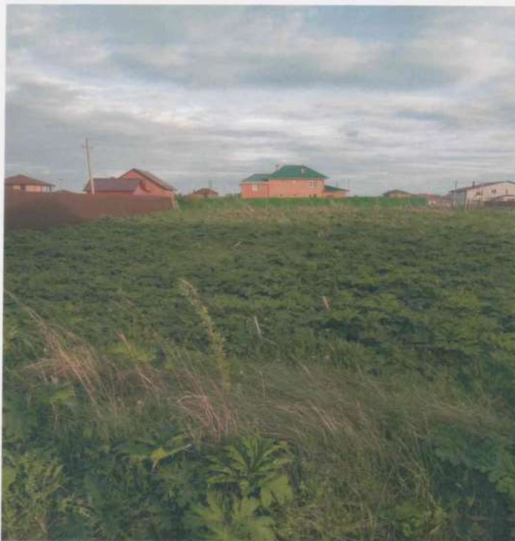
ФОТО № 1

Московская область, Лотошинский район, п.Кировский, поз.29 (адрес земельного участка)